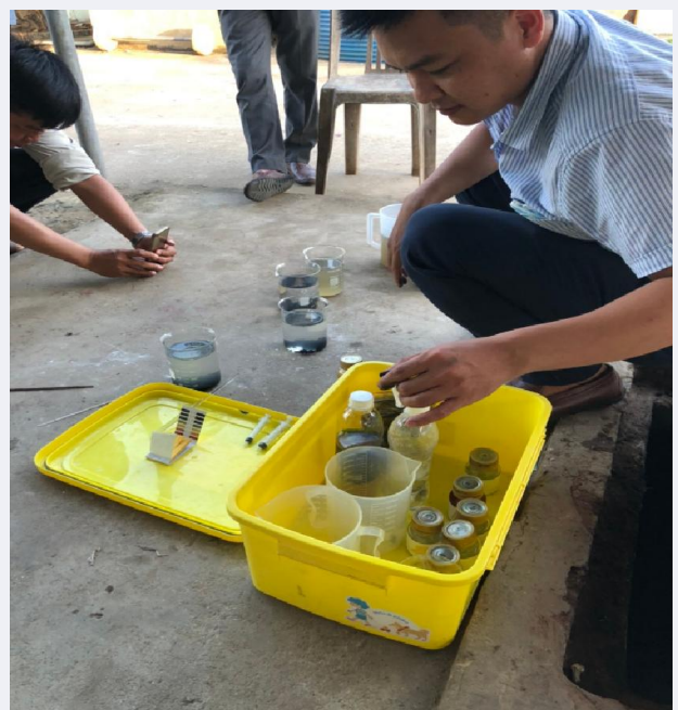
Hoạt động phân tích tại hiện trường