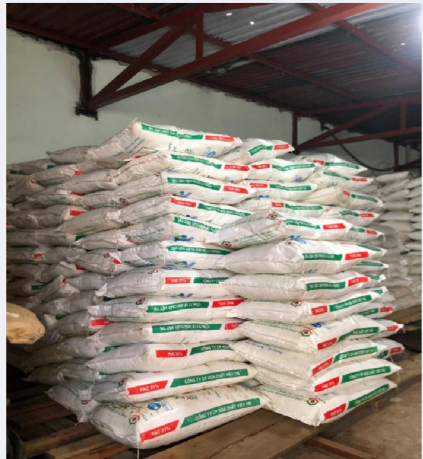
Kho chứa hóa chất