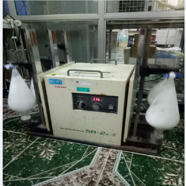
Hoạt động phân tích trong phòng thí nghiệm