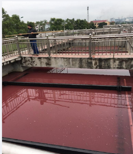
Hệ thống xử lý nước thải