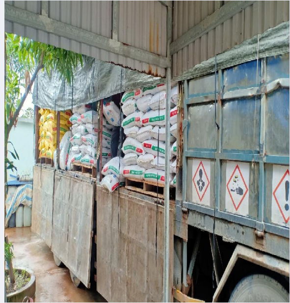
Hoạt động vận chuyển hóa chất